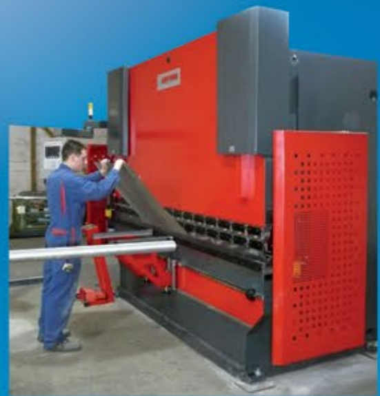
Presse plieuse CN : 3 m - 200 tonnes