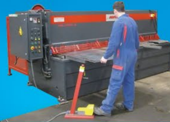
Cisaille : Capacité 3000 X 8 mm