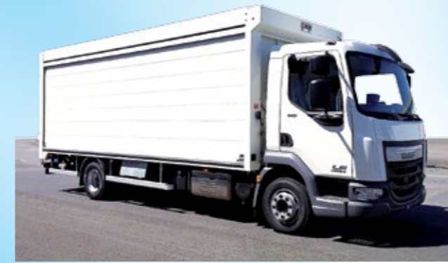
Carrosserie type brasseur

En fonction de vos besoins, nous étudions et nous réalisons vos aménagements, vos équipements d'intérieurs et d'extérieurs.