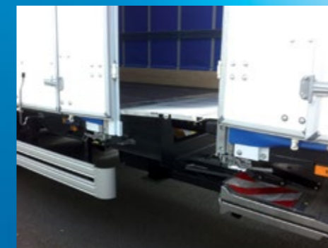
Passage camion remorque