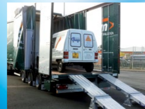
Cadre élargisseur hydraulique