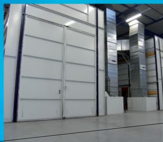
2 cabines de peinture : 19 m X 5 m X 5 m