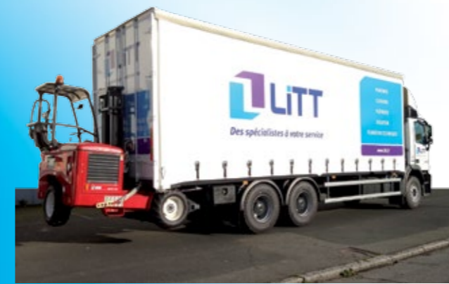
Équipement chariot embarqué