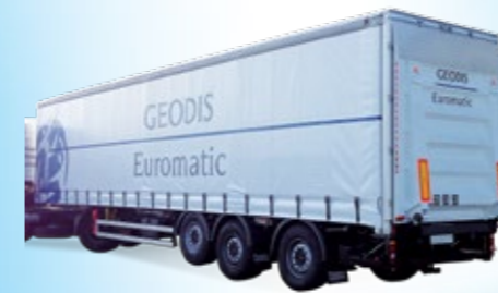
Hayon lourd : 5 à 9 tonnes